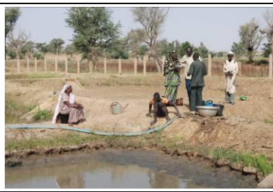
Bassins en terre à Kollo, touchés par l'inondation de 2012. Le promoteur construit une clôture pour placer un grillage fin capable de retenir les poissons