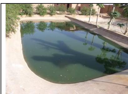
Bassins en ciment avec armature de fer à bétons et une profondeur de 3m (inutile). Le promoteur a commencé à les combler pour retrouver une profondeur conforme aux normes.