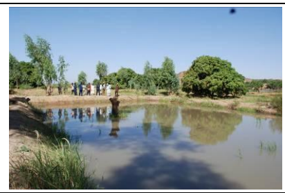
Bassins en terre sur une île du fleuve (Boubon), inondés en 2010 et 2012.