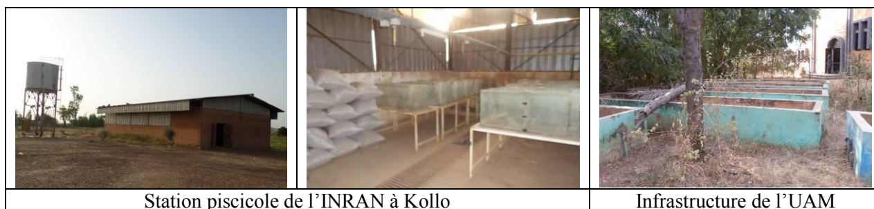
Station piscicole de l'INRAN à Kollo

Il faut rappeler que le Niger a démarré des activités de recherche en 1982 avec le projet pour le développement de l'aquaculture.