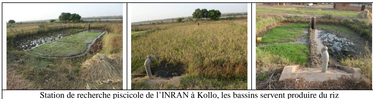
Station de recherche piscicole de l'INRAN à Kollo, les bassins servent produire du riz

Il faut rappeler que le Niger a démarré des activités de recherche en 1982 avec le projet pour le développement de l'aquaculture.