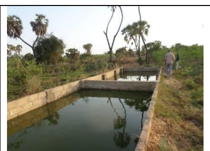
Bassins en parpaings. Compte tenu du coût, le promoteur est passé à l'utilisation de bâches.

La réalisation des infrastructures piscicoles coûte cher. C'est pourquoi tous les ouvrages de pisciculture commencent par le choix du terrain et le choix du type de bassin. On constate que certains promoteurs ont fait leurs bassins sans consulter au départ des techniciens confirmés avec une expérience avérée. C'est pratiquement le cas des trois promoteurs qui ont choisi l'option « ciment ». A la suite de cette première expérience, deux d'entre eux ont construit de nouveaux bassins avec bâches.