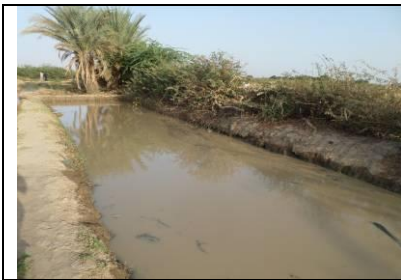
Bassin en terre au bord du fleuve Niger à Karey Gorou, réalisé et empoissonné en 2012 juste avant la crue du fleuve. Les poissons ont été perdus.