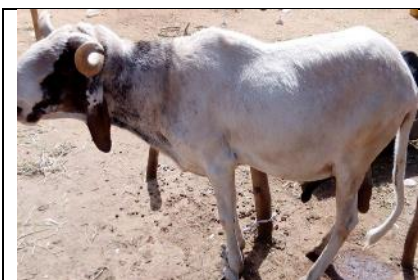
Bali Bali