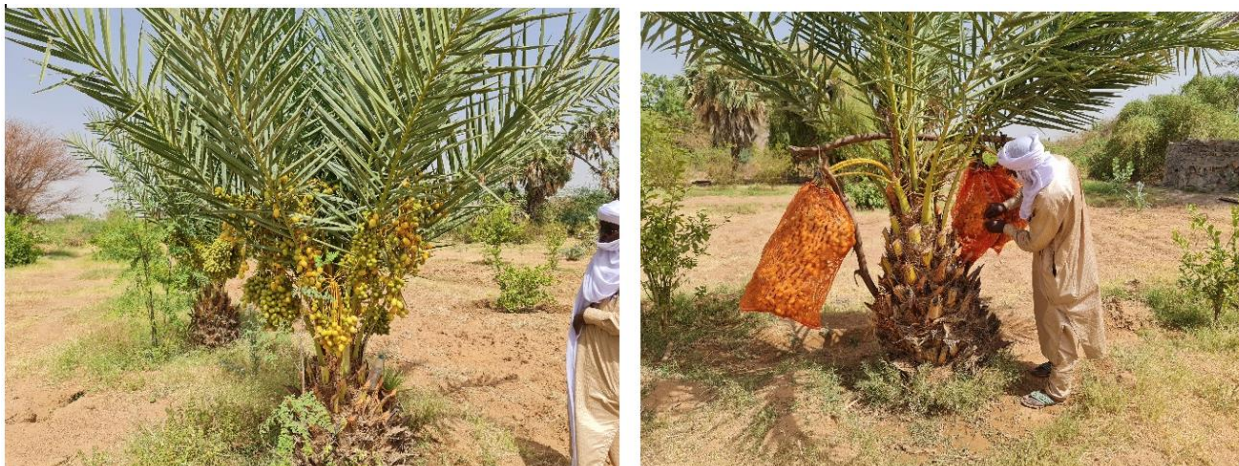
Jeunes plants productifs de dattes (gauche) et protection des fruits contre les attaques (droite) dans la vallée de Gofat – Agadez

Les rachis morts doivent être régulièrement enlevés pour le bien être du palmier. Ils sont utilisés par la suite pour la confection des abris pour les animaux et pour l'Homme, dans l'artisanat, l'alimentation animale etc. En cas de surplus, les rachis peuvent être vendus.