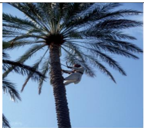
Mode d'utilisation du nécessaire de grimpage (M. TENGBERG, 2009)

Cette opération correspond à un élagage des organes desséchés ou en voie de l'être, qui le plus souvent gênent certaines pratiques culturales (pollinisation et récolte par exemple) et présentent de fortes infestations de cochenilles. Cette coupe doit être effectuée le plus proprement possible, à l'aide d'un outil tranchant. La coupe des palmes doit être réalisée le plus près du tronc, au niveau de la base du rachis afin de ne pas laisser d'épines en place.