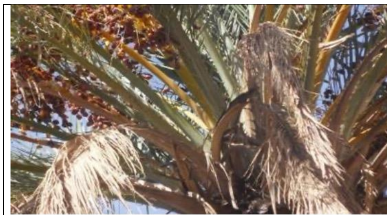
Vue de Palmes sèches à enlever (NOURANI Ahmed, 2008)