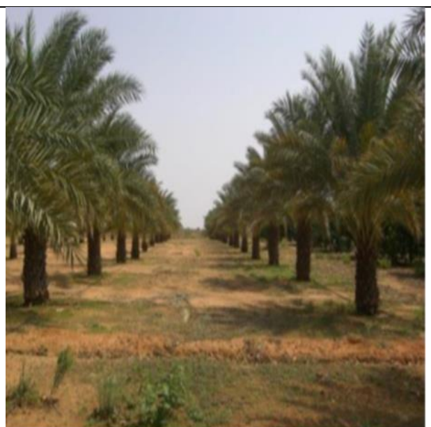
Le palmier-dattier (G. Peyron, 1994)