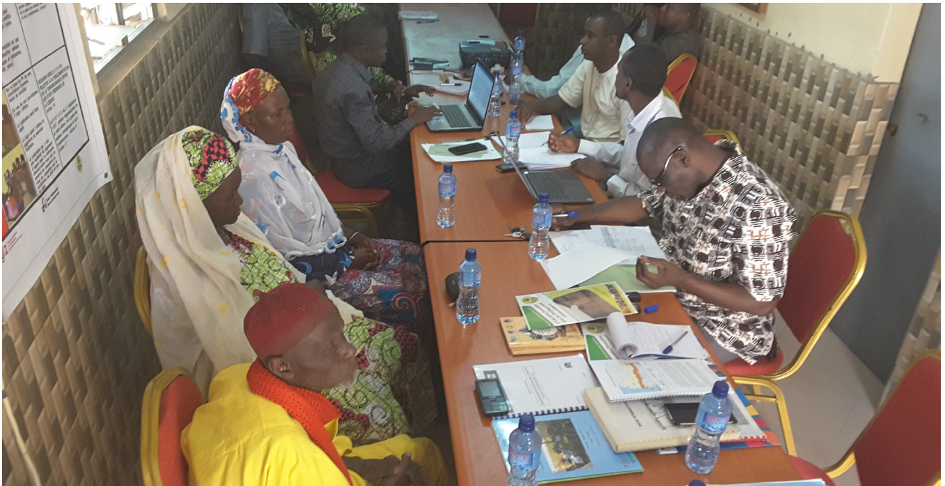
Une vue de la visite de terrain de l'équipe PEPISA0 aux organisations pastorales

Ces outils ont été répertoriés dans un guide pratique appelé Sensibilité à la Prévention et des Conflits.