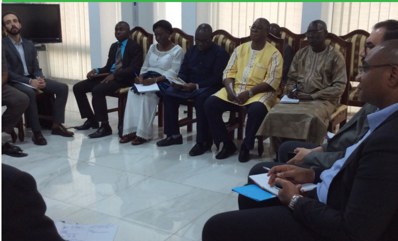
Les membres du CTP, dans la salle d'audience du MIRAH

Les membres du Comité technique du PREDIP ont été reçus en audience par le Directeur de Cabinet du Ministre des Ressources animales et halieutiques de Côte d'Ivoire, le jeudi 23 janvier 2020 après la clôture de leurs travaux.