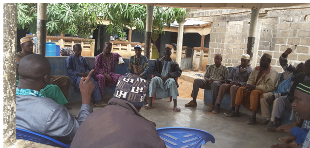
Vue des échanges avec les acteurs de terrain

Dans son fonctionnement, le PEPISA0 se positionne en appui et en complémentarité aux différentes initiatives en cours, pour développer une capacité régionale durable de gestion des enjeux liés aux différents systèmes d'élevage, en général et dans les zones d'accueil de transhumance et les zones jugées pertinentes au cours des études de faisabilité du projet en particulier.