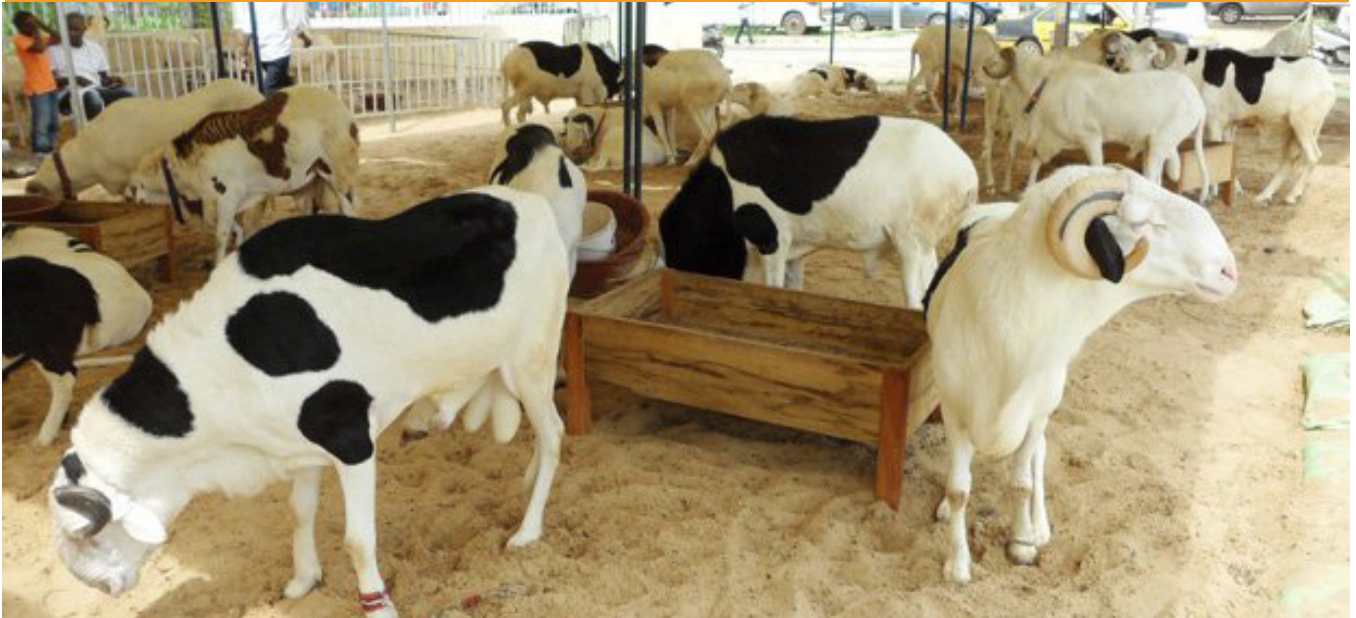
Des animaux sur un marché à Bétail au Niger

La Commission de la CEDEAO a procédé, en début du mois de décembre 2019, dans la ville frontalière de PAMELAP, au lancement d'une campagne de vaccination de masse contre la Peste des Petits Ruminants (PPR) en Guinée, Liberia et Sierra Léone.