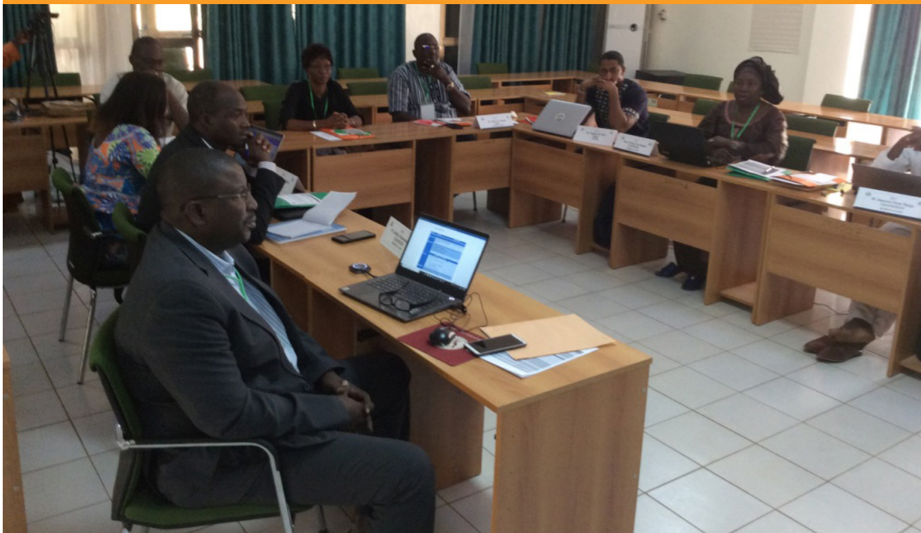
Les participants à la formation de l'équipe CILSS aux outils SPC à Niamey