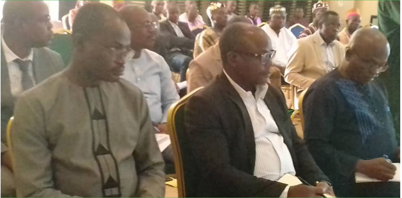
Vue des participants à l'atelier du CNT Togo

Le Comité national de Transhumance (CNT) du Togo a organisé l'atelier national sur le bilan des activités de la transhumance, du 16 au 17 décembre 2019 à Blitta.