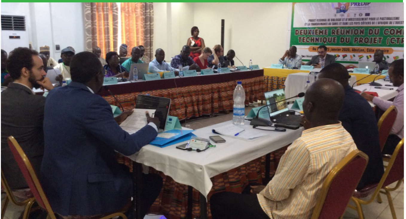
Les membres du CTP, au cours de la cérémonie d'ouverture des travaux à Abidjan

Organe de contrôle et de suivi technique du PREDIP, le Comité Technique du Projet (CTP) s'est réuni du 21 au 23 Janvier 2020 à Abidjan. Les responsables des composantes opérationnelles (Centre régional Agrhymet, CARE, AFL et CRSA) et leurs partenaires de l'UEMOA, de la CEDEAO et de l'Union Européenne ont répondu présents à l'appel du CILSS, institution de coordination du PREDIP pour la deuxième session du CTP. Les points focaux de sept pays officiellement nommés ont également pris part aux travaux.