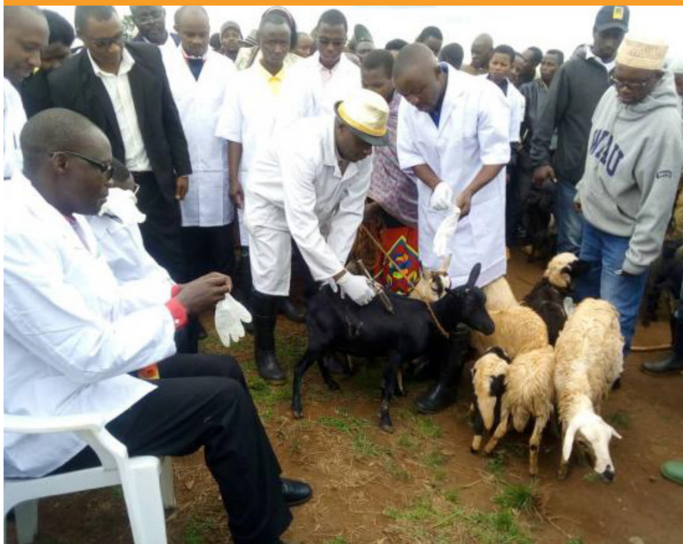
Lancement de la campagne de vaccination contre la PPR

La mise en œuvre de ce projet de lutte contre la PPR est coordonnée par le Centre régional de santé animale (CRSA) de la CEDEAO avec l'appui financier de la Coopération suisse pour le développement, de la Commission de la CEDEAO et de ses trois Etats membres bénéficiaires dudit projet.