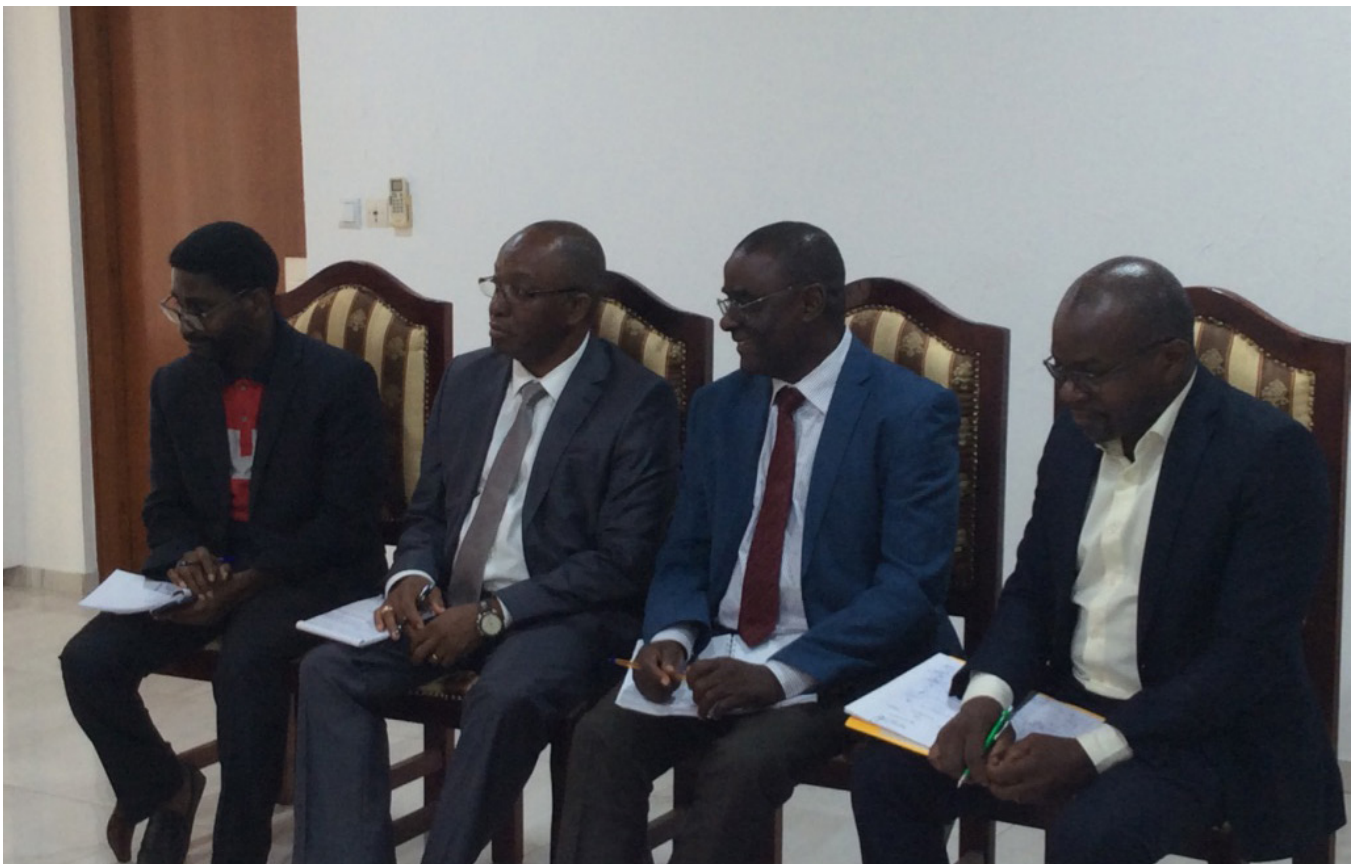
Le Directeur de Cabinet (3 e à partir de la gauche) avec ses collaborateurs au cours de l'audience

Il a insisté sur le renforcement des actions de production des aliments aussi bien dans les zones d'accueil que dans les zones de départ afin de contribuer à combler le manque de ressources fourragères, cause de l'accroissement de la mobilité du bétail. En outre, la question du pastoralisme doit être abordée de façon participative et inclusive avec tous les acteurs nationaux et régionaux.