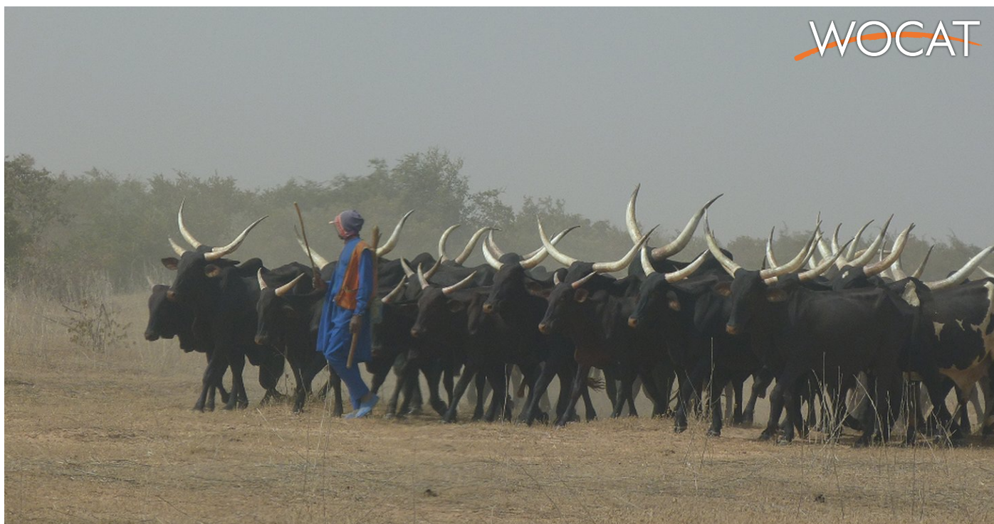
Éleveur transhumant dans la région de Maradi (VSF Belgique) (VSF Belgique)